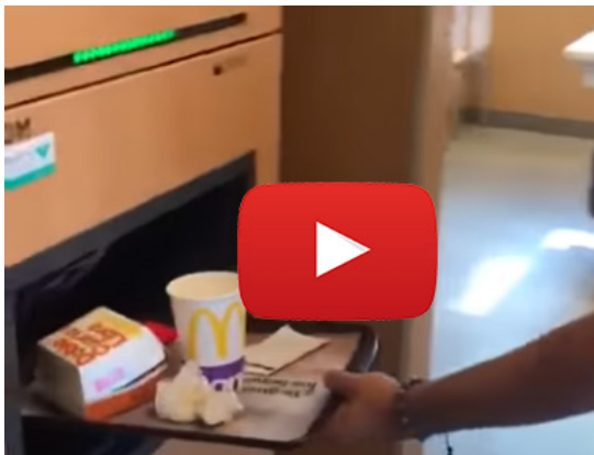
Ver TOM Junior de McDonald's Chile en uso en YouTube