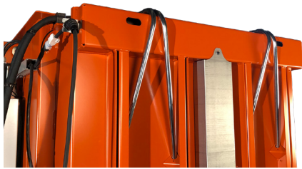
Buizen voor eenvoudig omsnoeren van de baal

Deze snelle balenpers heeft een cyclustijd van slechts 16 seconden en is in een oogwenk gereed voor een nieuwe lading kartonnen dozen of plastic folie. En automatisch starten is een standaardfunctie! 3220 kan handmatig worden gebruikt maar biedt maximale productiviteit en gemak in de automatische modus.