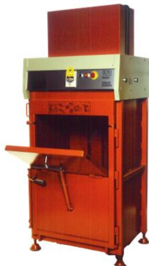
Orwak 8010 – världens snabbaste balpress vid den tiden!