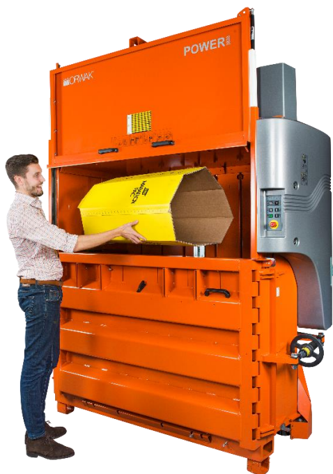
POWER har en kompakt design som underlättar vid transport och installation. Modell 3820 med ett extra generöst inkast för stora emballage.

Vid samma tid gjorde TOM entré på scenen och blev den nya arbetskamraten för många på restauranger, snabbmatsställen, gallerior och flygplatser. TOM tar hand om avfallshanteringen och håller ytor rena och inbjudande. Australien, USA, Förenade Arabemiraten, Bahrain och Chile är några av de länder där TOM har funnit sig väl till rätta. TOM är en smart automatisk papperskorg för offentliga miljöer med många besökare och tack vare effektiv komprimering, kan TOM hålla sju gånger så stor avfallsvolym som ett traditionellt sopkärl. Den automatiska beröringsfria luckan har, speciellt i COVID-tider, visat sig vara en viktig funktion och ett starkt säljargument.