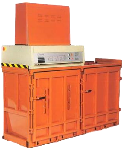
Flerkammarpresen Orwak 8020

Det glada 80-talet var goda tider med en stark ström av nyetableringar, speciellt inom livsmedels- och detaljhandeln och de nya butikerna behövde alla pålitliga och lönsamma avfallshanteringslösningar. Det var den starka expansionens decennium! Vi gick in på nya geografiska marknader och erövrade supermarketsektorn, när vi började leverera tusentals balpressar till olika supermarketkedjor. Vinden från väst var stark och många nya trender och influenser kom från USA. 1985 tog Orwak därför det äventyrliga steget in på den nordamerikanska marknaden, där vi bildade ett eget säljbolag. Takten i samhället och affärsvärlden ökade! Varje sekund räknades och det var vid den tiden som Orwak 8010, världens snabbaste vertikala balpress med en cykeltid på enbart 10 sekunder, såg dagens ljus!