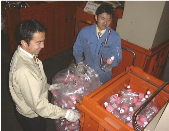
Ytan är av största vikt i Japan och det ger stark efterfrågan på lösningar för volymreduktion.

har snabba att rida på! Vi startade upp ett säljbolag på den nya lovande marknaden i Polen och gick in i Asien genom att etablera ett strategiskt partnerskap i Japan.