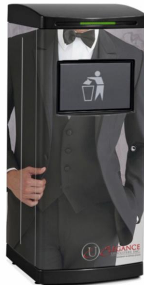
TOM festklädd och redo att fira Orwaks 50-årsjubileum!

TOM var den första Orwakmaskinen som kunde kommunicera och vi var en pionjär i branschen när vi introducerade tillvalet och kommunikationstjänsten "Orwak Connect" för modellerna i kärnsortimentet av vertikala balpressar. Det förhöjer kundupplevelsen att se aktuell status på maskinerna och kunna samla in värdefull balstatistik över tid. I den digitaliserade värld vi lever i med M2M-kommunikation och där appar i våra iPhones underlättar nästan varje aktivitet i vardagen, är det naturligt för oss att erbjuda samma funktioner till våra balpressar. QR-koder är en annan nyhet på våra maskiner. Med ett klick med din iPhone, får du tillgång till användarmanualen på ditt språk och en kort instruktionsvideo på YouTube.