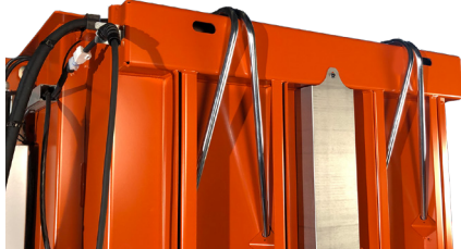
Tubos para un fácil flejado de la bala