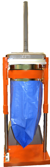
Altura de vaciado de 2.660 mm de serie

Es sencillo introducir materiales en la unidad de carga superior abierta. La compactadora es segura y fácil de manejar y la función de elevación integrada permite cambiar la bolsa de forma rápida y cómoda.