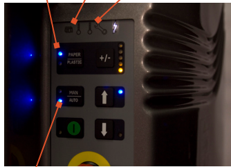
Tamaño de bala ajustable

Selector de material para cartón y plástico Indicador de bala completa Indicador de servicio