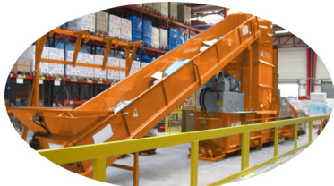
Opción: cinta alimentadora

Una solución completamente automática para la gestión de residuos y diseñada para una continua alimentación con un sistema automático de atado vertical con la posibilidad de ajustar la longitud de la bala permitiendo así una óptima producción.