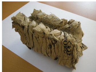
Briquette petite et compacte