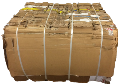
'Mill-size' balen met een hoge dichtheid

De onderste deur heeft een vergrendelings-systeem met wieltjes en kan door de operator op veilige wijze geleidelijk worden geopend, ook bij het samenpersen van materiaal dat uitzet.