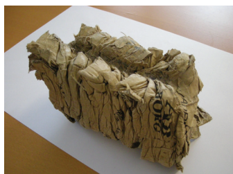
Kleine en compacte briketten