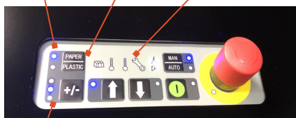
Taille de balle réglable