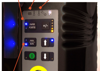
Taille de balle réglable

Sélecteur de matériaux : carton ou plastique Indicateur de balle complète Indicateur d'entretien