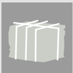
FIXATION TRANSVER- SALE

L'ORWAK COMPACT 3115 est indiquée pour des petits volumes de papier et plastique, mais elle est aussi conçue pour le compactage du carton. Un sélecteur de matériaux facilite la sélection des déchets ! La fixation transversale sécurise la balle, et cette fonction est particulièrement utile pour le compactage du plastique souple ou des petits morceaux de matériaux.