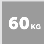
BAAL- GEWICHT KARTON